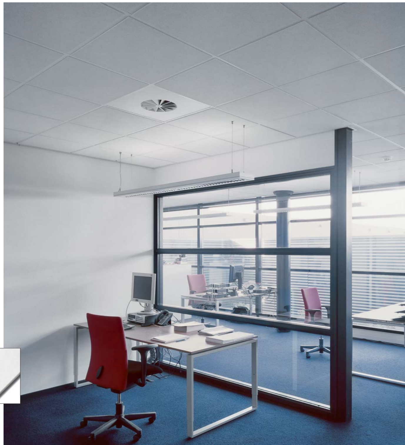
▼ Ultima dB