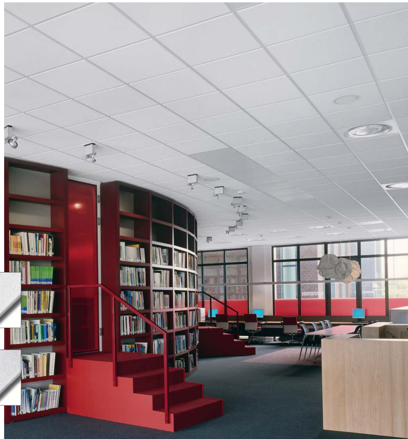
▼ Sahara Tegular

In aggiunta alle normali garanzie dei prodotti Armstrong, la gamma Dune offre una maggiore durata nel tempo ed un assorbimento acustico potenziato.