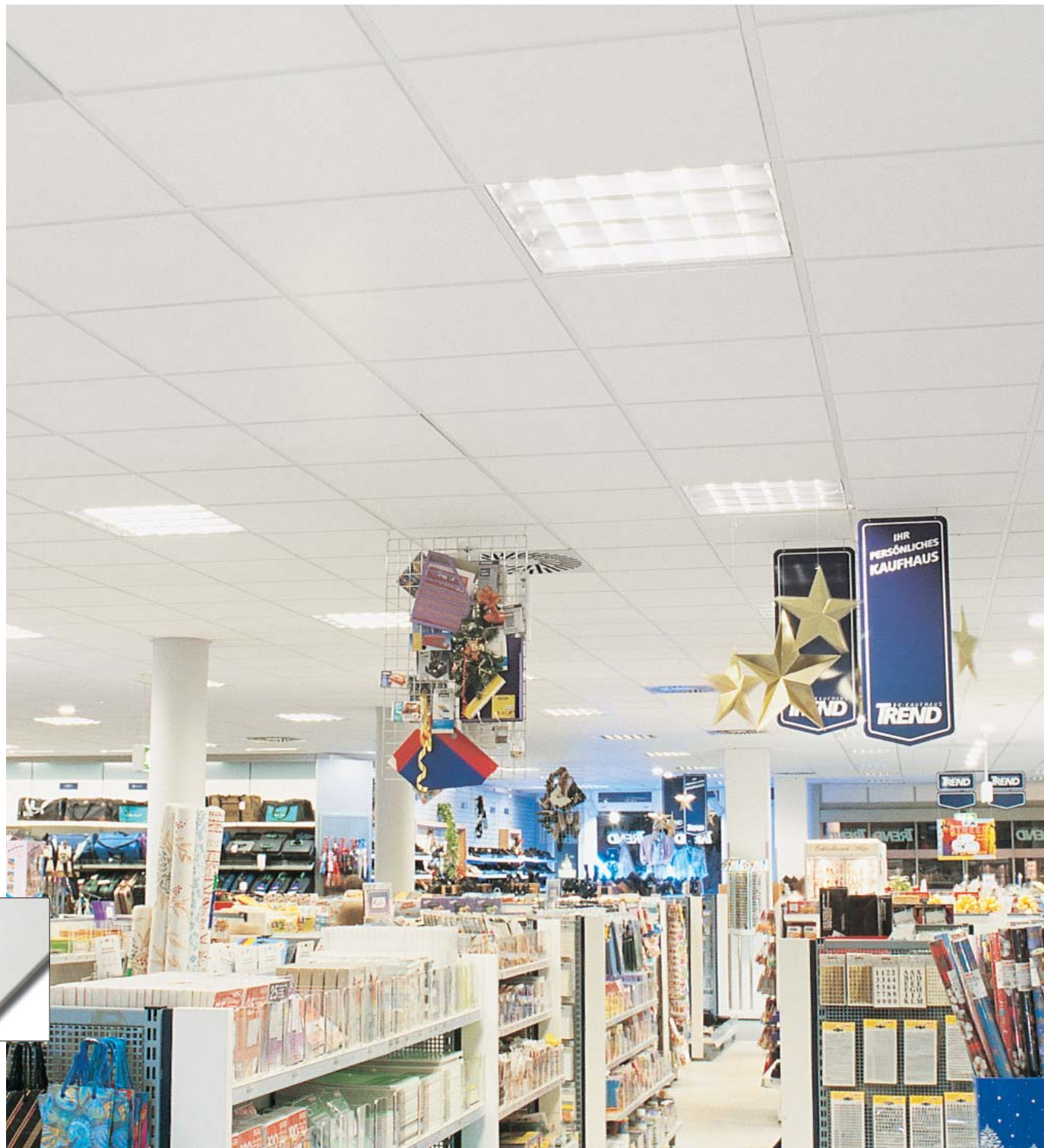
▼ Plain Tegular

La superficie liscia e bianca di Plain rispecchia la tendenza attuale verso finiture più lisce. Con la sua elevata riflessione della luce, Plain ottimizza l'illuminazione indiretta e permette di creare un ambiente di lavoro piacevole e persino di ridurre i costi di energia.