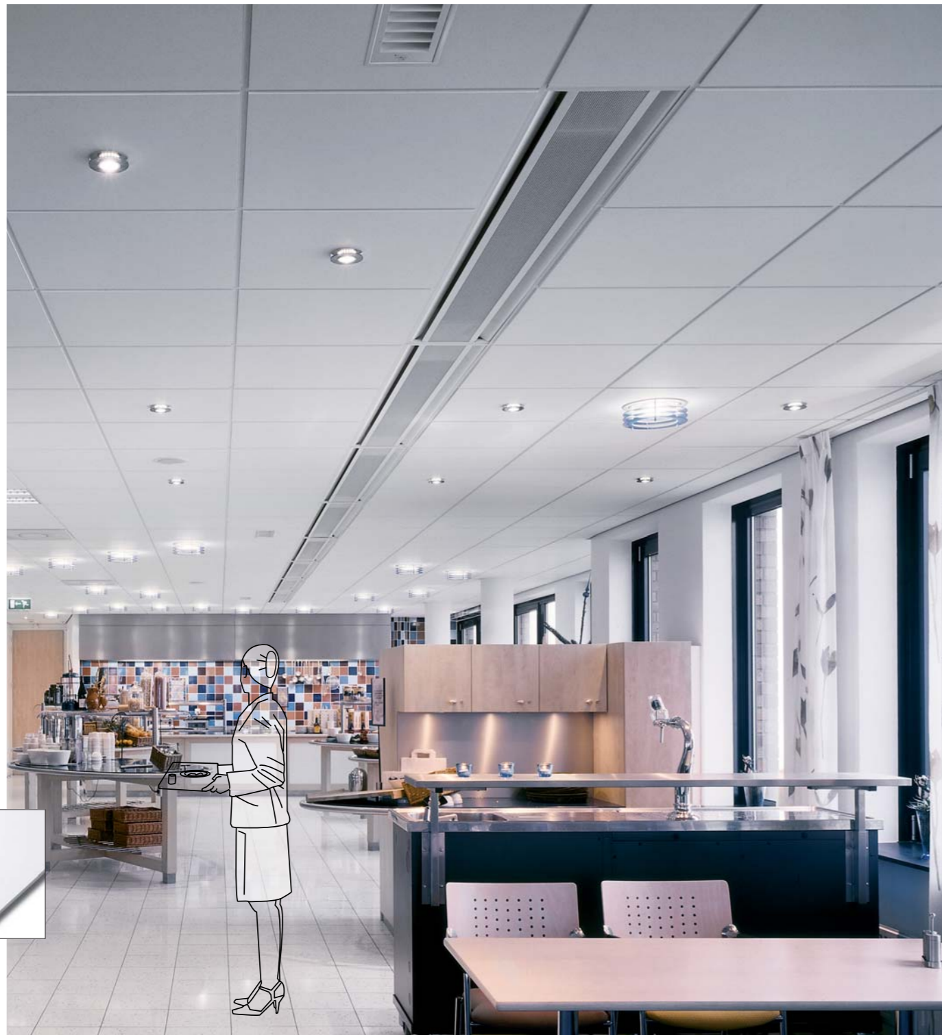
▼ Perla OP

Perla OP si propone di rispondere al meglio alle esigenze di grandi spazi aperti ove è primordiale il controllo del rumore.