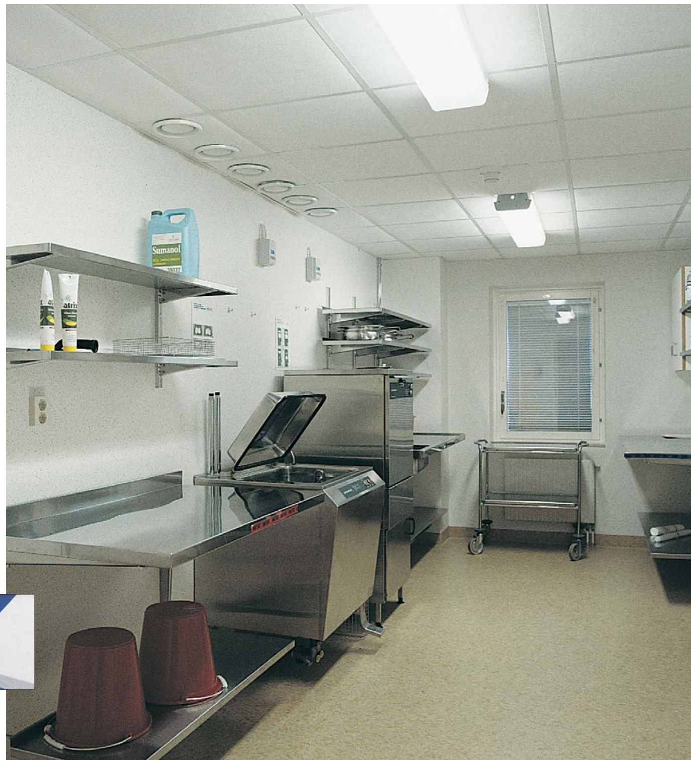
▼ Parafon Hygien

* Grazie alla sua superficie rinforzata, Parafon Hygien resiste alla pulitura con acqua a pressione, fino a 80 bar, utilizzando un getto diffuso di minimo 30°, a una distanza di minimo 30 cm e con un angolo di applicazione di 45°. Prima di procedere alla pulitura i pannelli Parafon Hygien vanno fissati all'orditura di sostegno mediante apposite clip di fissaggio.