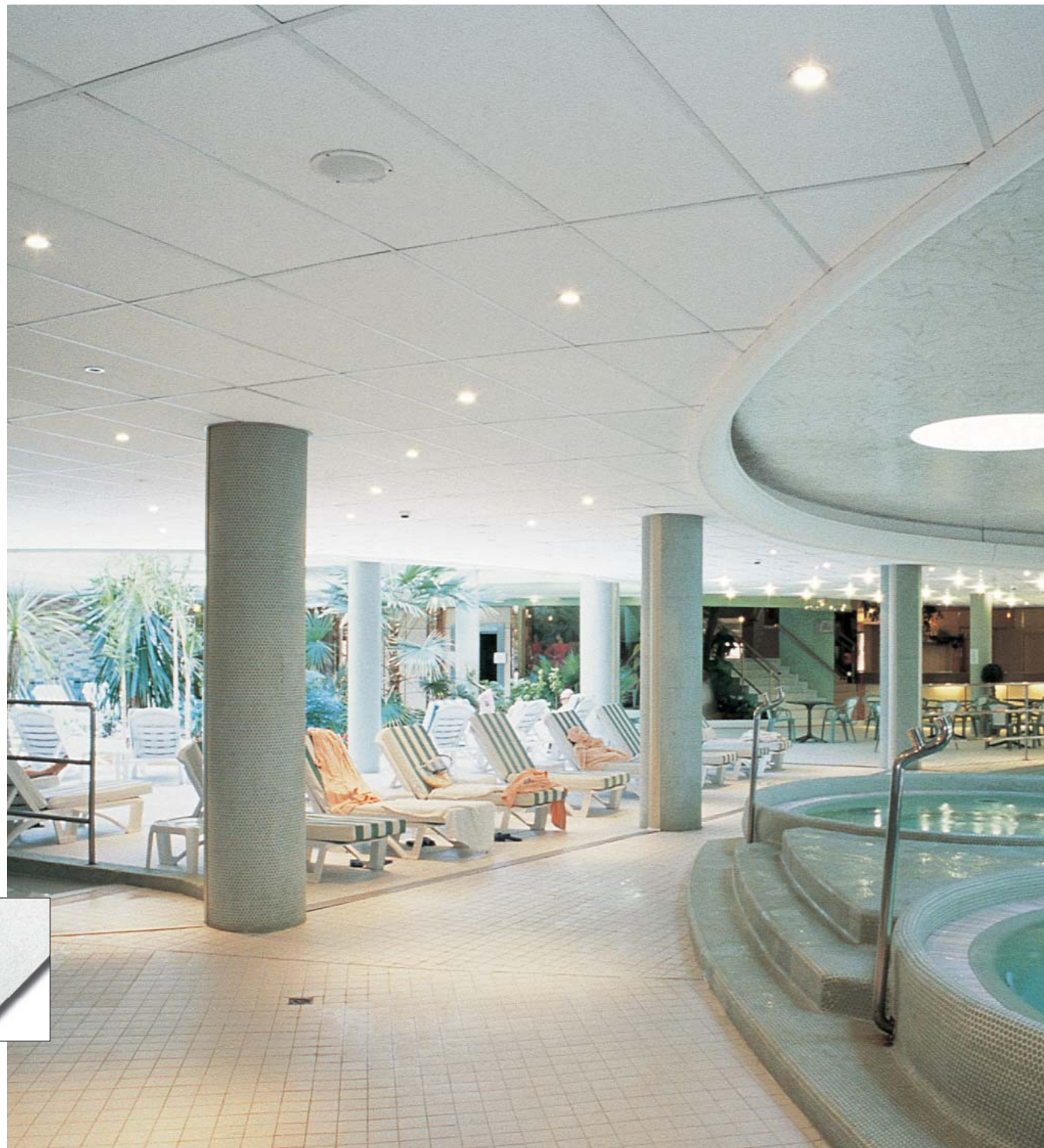
▼ Newtone Board

Newtone è un pannello in calcio silicato particolarmente adatto per ambienti soggetti a notevoli sbalzi di temperatura, in aree industriali e semi-aperte, dove la resistenza ad urti e danneggiamenti costituisce un fattore determinante nella scelta del prodotto.