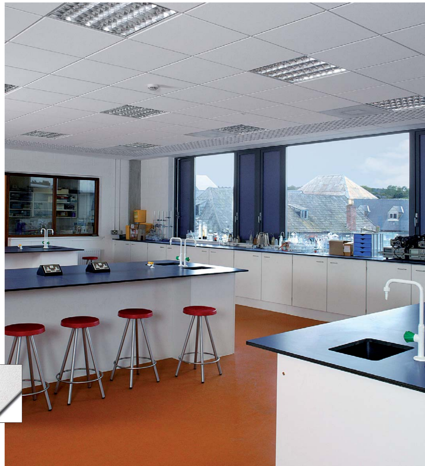
▼ Cirrus MicroLook

Cirrus presenta una finitura "calda" ed uniforme. Grazie all'abbinamento di una buona acustica a vari tipi di dettaglio bordi, Cirrus consente diverse possibilità di design ad alte prestazioni.